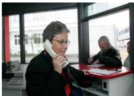
Ein freundlicher Empfang ist eine der besten Visitenkarten für ein Unternehmen.

Cofely AG Holeestrasse 87 CH-4015 Basel Tel. +41 61 306 66 00 Fax. +41 61 306 66 10 basel@cofely.ch www.cofely.ch