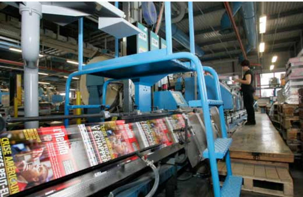
Druckzentrum von Ringier Print Zofingen AG.